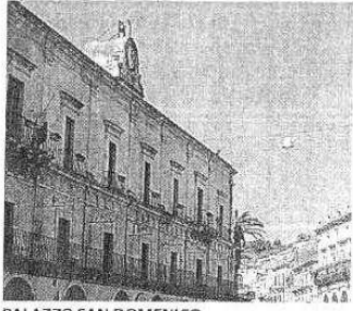
PALAZZO SAN DOMENICO

Protezione civile. Il Comune ha pubblicato un avviso pubblico. E' possibile aderire entro sessanta giorni